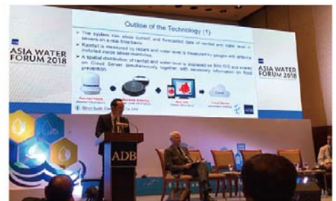
国際会議でのプレゼン (Asia Water Forum 2019 @ Manila)