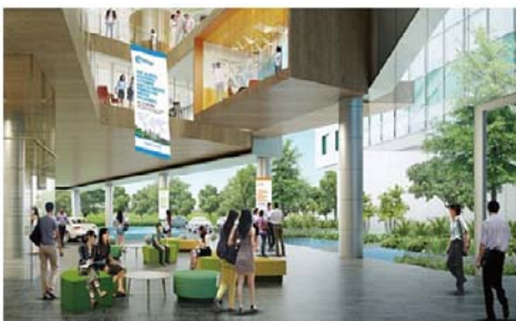
シンガポール支店の設立 (Singapore Water Exchange)