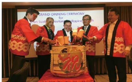
フィリピン支店の設立（開所式）