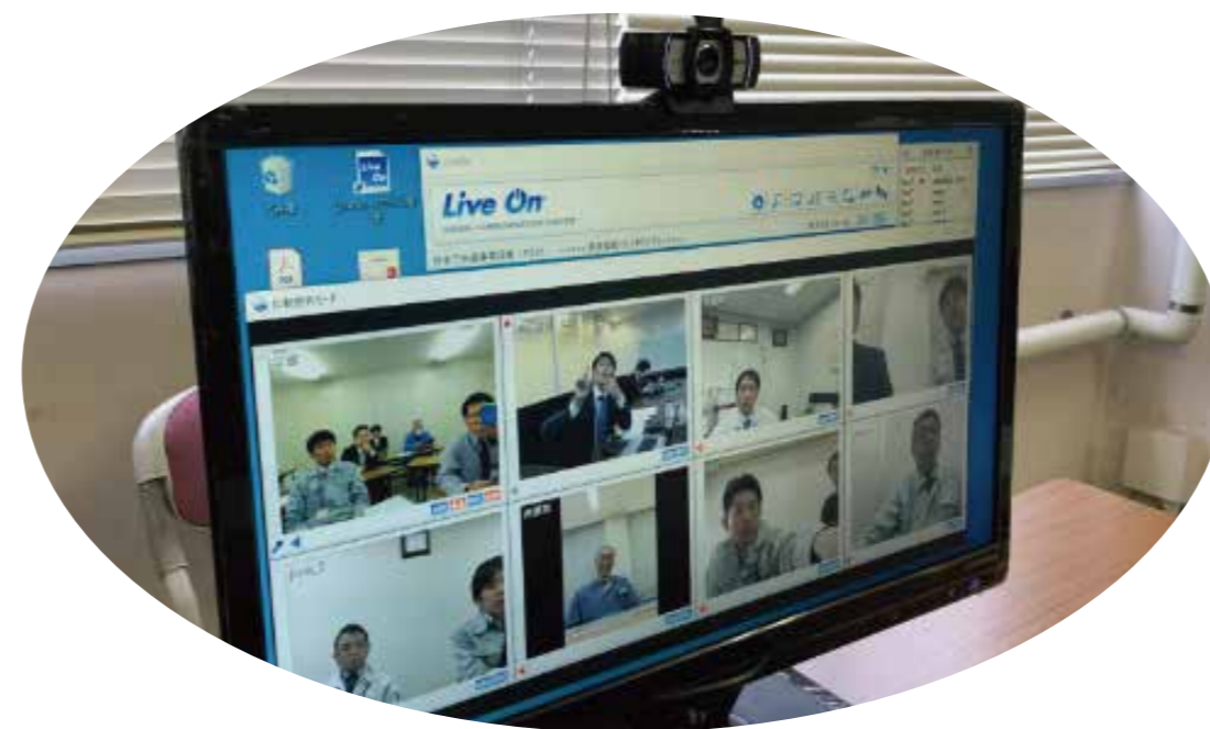
『計画策定後に想定される検討』