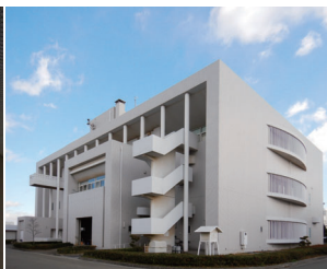
特徴的な外部階段。