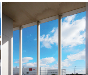
空を切り取るデザイン。