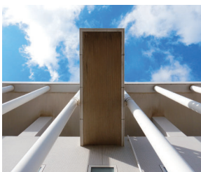
アクセントとなるバルコニー。