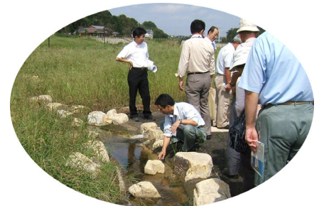
参加者による現地確認の様子