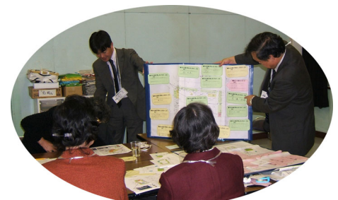
ワークショップの開催の様子