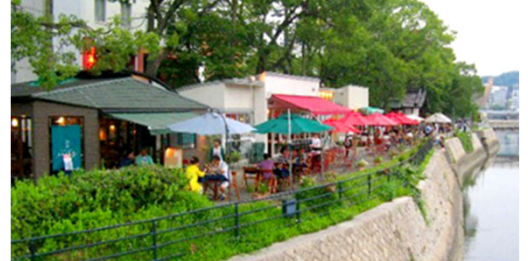
図1 水辺のオープンカフェ(広島県広島市)