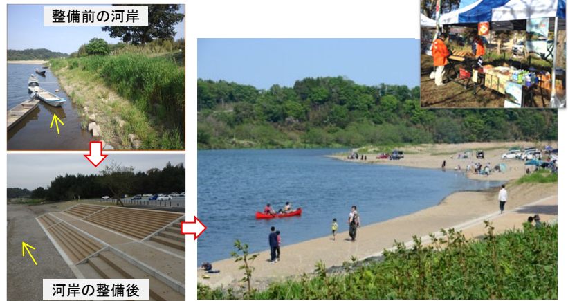
図2 親水護岸整備による利用促進(那珂川;茨城県城里町)

【ハード施策】まちづくりと一体となった治水上及び河川利用上の安全・安心に係る河川管理施設の整備